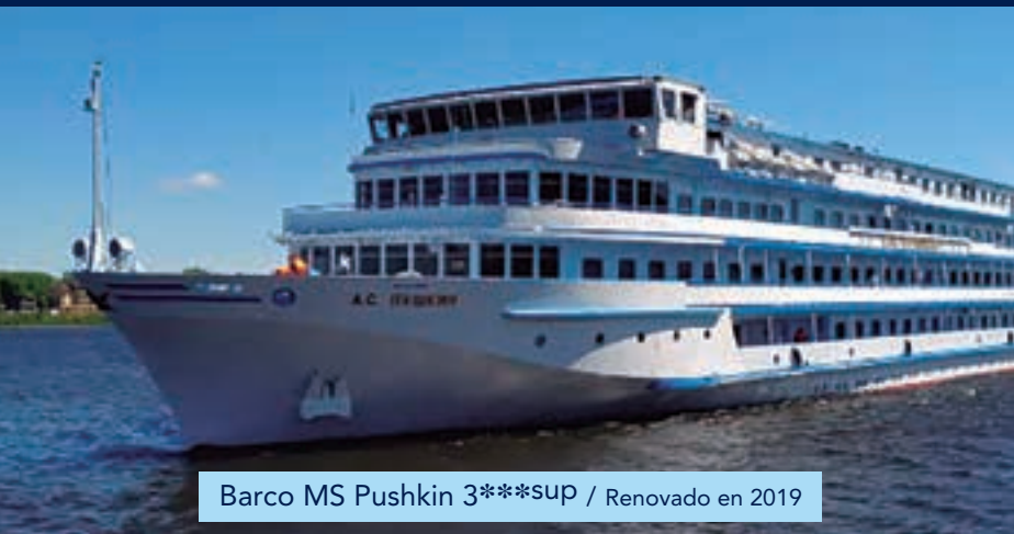
Barco MS Pushkin 3***SUP / Renovado en 2019