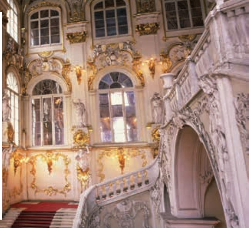
Escalera en el Hermitage