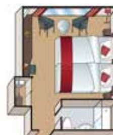
Camarote, Mozart y Strauss