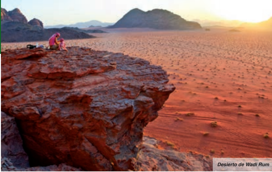
Desierto de Wadi Rum

anchura, fue construido probablemente en el siglo I a.C, cuya fachada, bellamente esculpida, es mundialmente famosa; el Monasterio, el edificio más remoto de la ciudad; el Anfiteatro con un aforo de 800 personas, y el Templo de los Leones Alados. Almuerzo (opción T.I.). Por la tarde regreso al hotel. Cena y alojamiento.