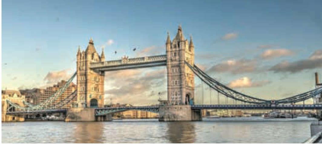
Puente de Londres

disfrutar contemplando el famoso "David" de Miguel Angel y otras obras maestras. Cena (opc. MP) y alojamiento.