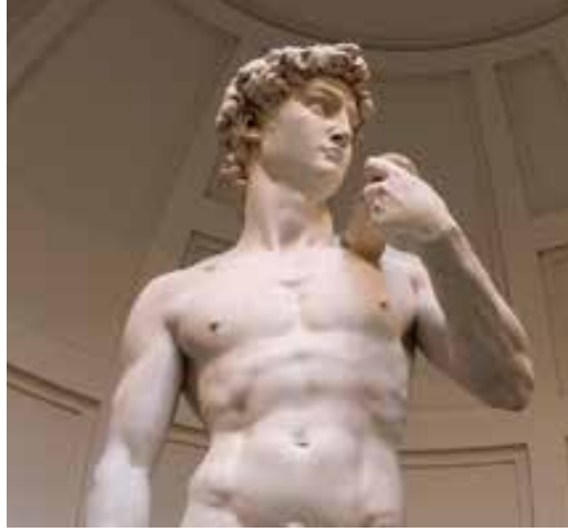
El David de Miguel Ángel (Florencia)

llo de Santo Angel, la famosísima Plaza de Venecia. Por la tarde realizaremos opcionalmente la visita de Roma barroca; recorrido por las principales plazas de la ciudad, visitando la famosa Fontana de Trevi, Panteón y la espectacular Plaza Navona. Alojamiento.