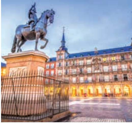
Plaza Mayor (Madrid)