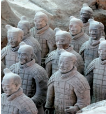
Guerreros de terrracota (Xián)