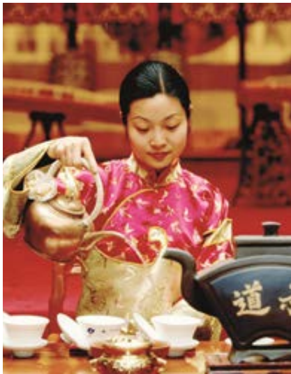
Ceremonia del té