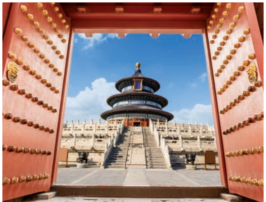
Templo del Cielo

Desayuno buffet. A la hora indicada, traslado al aeropuerto para embarcar en vuelo con destino a