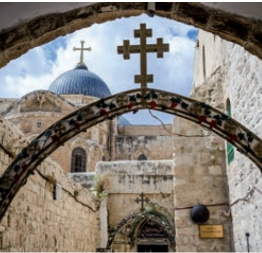
Santo Sepulcro (Jerusalén)