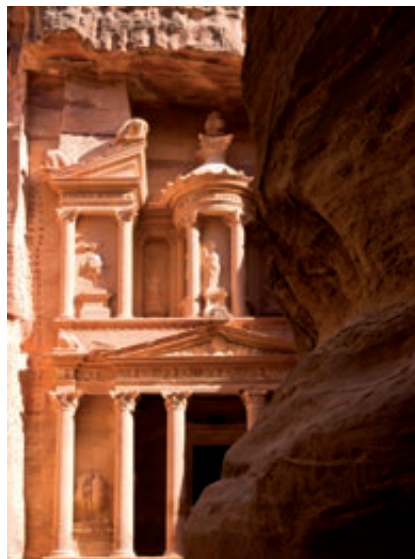
El Tesoro (Petra)

Desayuno. A la hora indicada, traslado al aeropuerto. Fin del viaje y de nuestros servicios.