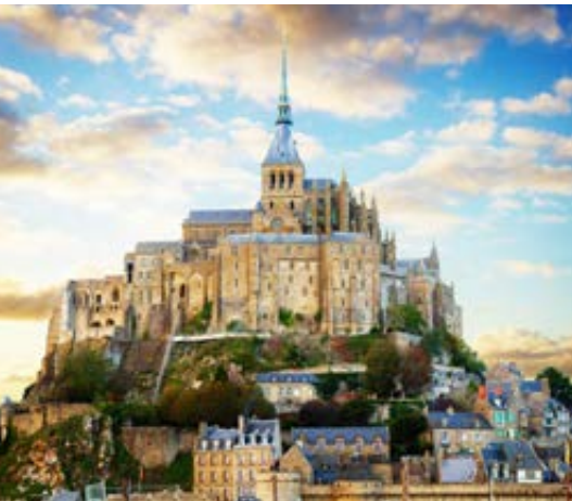
Mont St. Michel (Francia)