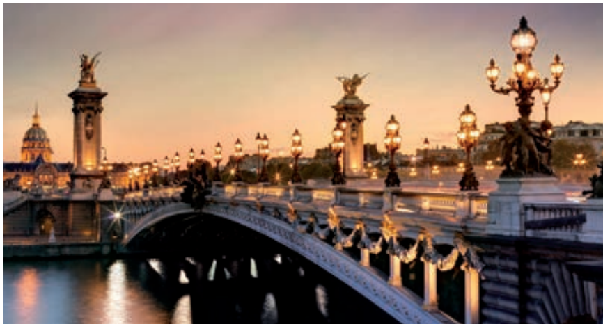
Puente de Alexandre (París)

Desayuno buffet . Hoy tenemos una visita opcional interesantísima a los Museos Vaticanos, Capilla Sixtina y el interior de la Basílica de San Pedro. Comenzamos visitando los Museos Vaticanos, el gran patio de la Piña, la sala de la Cruz, la Galería de los Candelabros, la de los tapices, la de los mapas, la sala Sobiesky y de la Inmaculada, al final entraremos en la Capilla Sixtina, gran obra maestra de Miguel Ángel, con todos sus frescos restaurados. Después pasaremos a la Basílica de San Pedro, construida en el lugar del Martirio del Santo y reconstruida después; de ella destaca imponente su cúpula, obra maestra de Miguel Ángel. En su interior se conservan importantes tesoros,