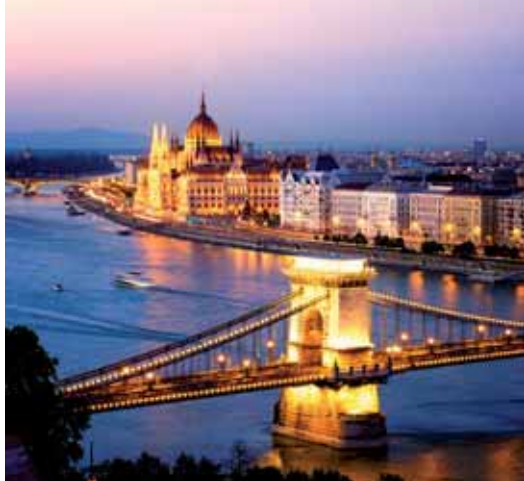
Puente sobre el Danubio (Budapest)