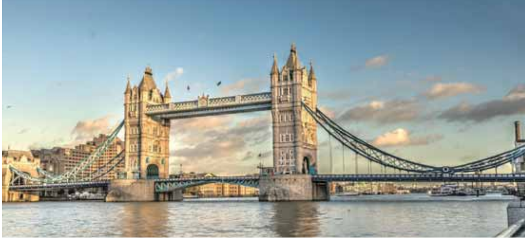
Puente de Londres

una fábrica de cristal de Murano. Resto del tiempo libre en esta ciudad asentada sobre 118 islas en el mar Adriático. Aconsejamos pasear por sus típicas callejuelas hasta el Puente Rialto y efectuar un paseo en góndola (opcional) por los típicos canales venecianos. Cena y alojamiento.