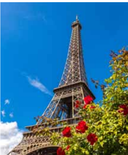
Torre Eiffel (París)