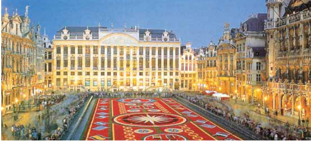
Grand Place (Bruselas)

ciana entre bellísimas vistas. Empezaremos nuestra visita panorámica (inc) por la impresionante Plaza de San Marcos. Visita a una fábrica de cristal de Murano. Resto del tiempo libre en esta ciudad asentada sobre 118 islas en el mar Adriático. Aconsejamos pasear por sus típicas callejuelas hasta el Puente Rialto y efectuar un paseo en góndola (opcional) por los típicos canales venecianos. Cena y alojamiento.