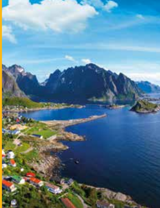
Islas Lofoten. NORUEGA.