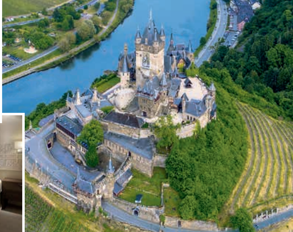
El Castillo de Reichsburg en la ciudad de Cochem, en el río Mosella.